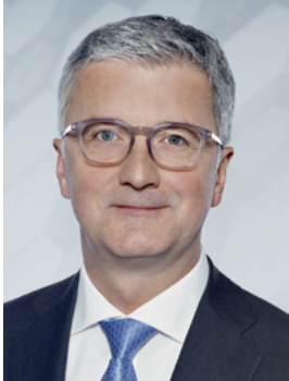
Prof. Rupert Stadler